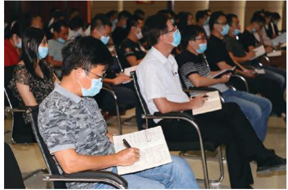
参会人员认真做笔记

“生命线”，视党纪国法为“高压线”，视作风规定为“警戒线”，同时要增强拒腐防变的免疫力，净化工作生活的社交圈。三是要把敢担当有作为视为最基本的职责使命。要求广大党员干部牢固树立大局意识、担当意识和责任意识，要