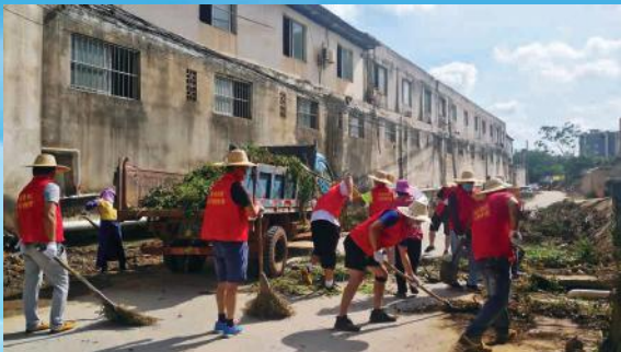
1 清除杂草，还道路洁净