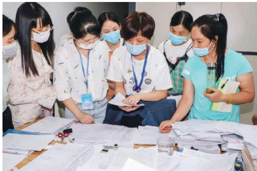
与会人员就档案问题现场进行深入交流

排序、装订、分类、盖档号、编目、装盒进行一一细致讲解。不少参训人员就日常档案管理