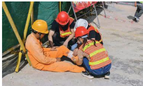
荣鑫公司应急演练现场

现场模拟一名工人在 2#、3# 厂房间的廊架上进行施工作业时，因未系安全带、脚下未踩稳造成高处坠落受伤，其他人员对其进行急救的情况。从发现人员坠落受伤、疏散人群、封锁现场到对受伤人员骨折部位用夹板进行固定再送至医院，仅历时 10 分钟。整个过程紧张有序，应急处理得当。演练中，现场每名救援人员严肃认真对待每个演练细节。各应急小组闻