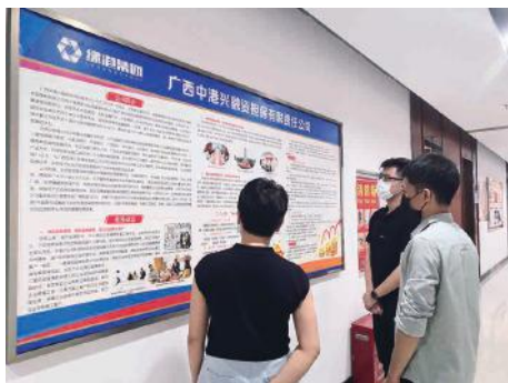
员工们在“争做金融好网民”主题板报前认真学习

中港兴公司结合近期集团公司开展的供应链贸易融资担保业务，积极组织员工对“网上平台企业信息查询”“应收账款确权实务”等专题开展培训，使各部门员工加深对供应链贸易融资知识的了解，强化运用“企查查”“信用中国”等网络工具对被保企业开展全面深入的尽职调查，提高了员工的金融风险防范意识和专业技能水平，以打牢业务安全基础，实现业务风险防控。公司还针对当前诱贷诈骗、违