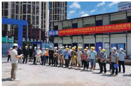
科巨公司在经开区实验幼儿园组织开展消防演练活动