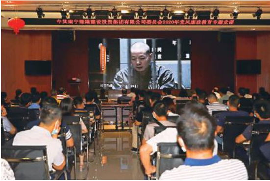
观看警示教育片现场