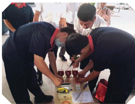
技能竞赛活动现场

行政管理等知识竞赛活动，通过以赛促学，全面打造学习型、技能型的职工队伍，为入驻企业提供质量优良的物业服务。