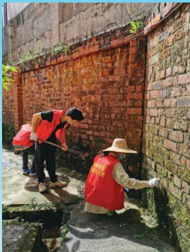
3 铲掉青苔，复砖红墙面