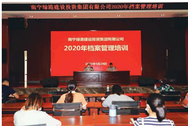
绿港集团举办2020年档案管理培训班

集工作要求、工程项目档案整理标准及档案数字化要求进行系统讲解。为更快让参训人员掌握规范档案整理工序，此次培训还在档案室安排现场教学，培训师从对档案的收集、组件、