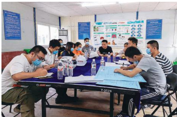
主体结构验收总结会

总建筑面积约为 4677.35 m 2 ，地上 4 层，按照 12 个班规模设计，计划 2020 年秋季开始招生。