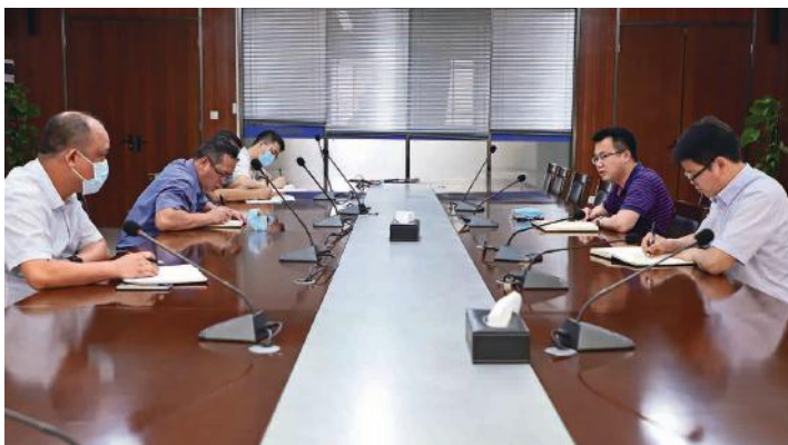
绿港集团组织召开水环境综合治理工作推进会