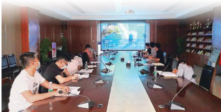
团员观看抗疫纪录片《冬去春归·2020疫情里的中国》

近年来，在经开区团工委、集团党委的带领下，绿港集团团总支紧扣爱党爱国主题，围绕企业经营发展大局，大力建设学习型团组织，带领团员们深入一线，扎实推进各项业务工作。同时积极响应共青团中央发起的“爱国不犹豫，爱国晒出来——我和国旗合个影”主题活动，开展了“奋斗绿港，青春同行”等丰富多彩的爱国主题教育活动，获得经开区团工委等上级部门的好评。