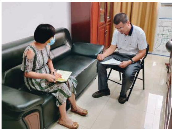
嘉通公司党支部组织开展“红心向党，建功绿港”谈心谈话活动

我的外公和父亲生前都是优秀的老党员，他们时刻以党员标准严格要求自己，在各自平凡的工作岗位上实现了人生的价值。我希望自己能传承父辈身上可贵的党员精神，在精神上