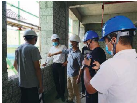
主体结构验收现场

5月18日下午，由绿港集团下属科巨公司负责代建的经开区实验幼儿园项目主体结构分部工程顺利通过验收。此次验收的通过，为后续机电安装、装饰装修等工程创造了进场施工条件，标志着经开