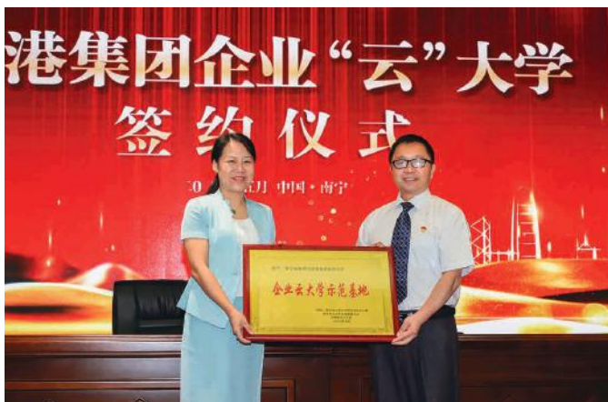
（国际）职业能力实训与测评项目办公室、南宁市企业和企业家联合会、软实力学院联合授予绿港集团“企业云大学示范基地”称号

下一步，绿港集团将充分利用互联网的培训平台以及软实力集团的优质课程打破教育资源地域性的难题，为企业内训师提供网红讲师直播平台，把“绿港云大学”打造成职工教育培训、资源共享、营销传播的重要基地。同时，集团公司将充分利用政府在疫情期为企业减负、提供职业技能培训补贴的利好政策，依托区内具有“双千结对”的职业技能等级认定机构开展岗位技能培训，申领企业