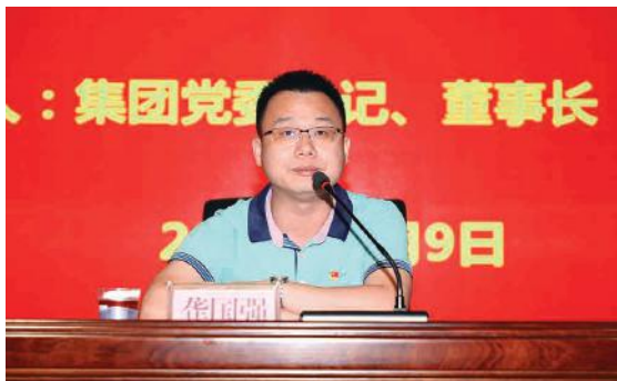
龚书记对全体党员干部提出工作要求

随后，龚书记以“真抓实干，敢为人先，做有担当敢作为的党员干部”为主题为大家上党课，他从既要当好“指挥员”，又要当好“战斗员”、既要有“老黄牛”的品格，又要有“千