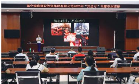
绿港集团举办 2020 年“安全月”专题知识讲座

例，以视频和图片的形式给大家展示了各类火灾发生后的严重后果。为增强参会人员火灾防范意识，培训老师将身边常见的电动自行车火灾、汽车火灾、家庭火灾等案例起因、防范措施详细告知，并强调及时扑灭初期火灾的重要性，要求大家预防为主，遇灾冷静，切勿慌乱，学会自救。同时，培训老师现场演示了消防器材的正确使用方法，包括泡沫灭火器、水基型灭火器、防烟面罩等。