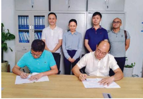
绿港集团与十一冶集团成功签约

5月26日，绿港集团下属九略公司与十一冶集团公司签订合作协议。双方就防城港钢铁基地项目钢材供应达成协议。这也是绿港集团首次通过“金投云链”平台与客户成功签约。