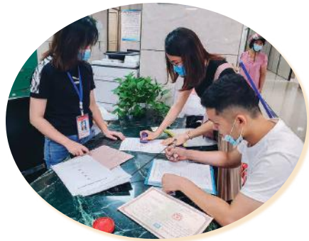
中港兴担保公司人员和客户办理不动产抵押手续

今年上半年，公司累计为12家被保企业办理融资续保10250万元，为3个经开区新开工工程项目开具98.41万元的工程履约保函业务，以国有担保企业的责任担当和专业尽职的服务陪伴中小微企业渡过疫情和经营的“寒冬”，为企业恢复正常生产经营和经济社会复苏贡献力量。同时，中港兴担保公司还对被保企业提供担保费率优惠政策，解决企业融资贵的问题，得到了南宁市政府及经开区管委会的支持。