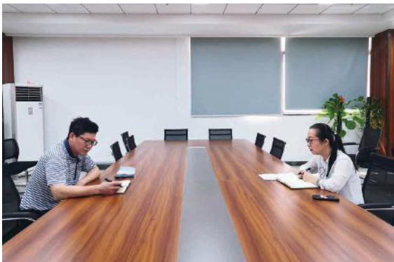
绿港集团机关第一党支部开展“红心向党，建功绿港”谈心谈话活动

在今天的疫情防控斗争中，在中国共产党的集中统一领导下，党政军民学、东西南北中一体行动，广大党员们冲锋陷阵的身影让我深受鼓舞。作为一名入党申请人，我主动请缨，按上级要求建立集团公司员工身体健康“日报告、日统计、特殊情况随时报”的工作机制，做好员工健康动态摸排、跟踪与统计工作。疫情得到控制后，为了助力复工复产工作，减轻集团公司经营生产压力，在集团公司领导的带领下，我主动与南宁市社保局沟通，组织各子