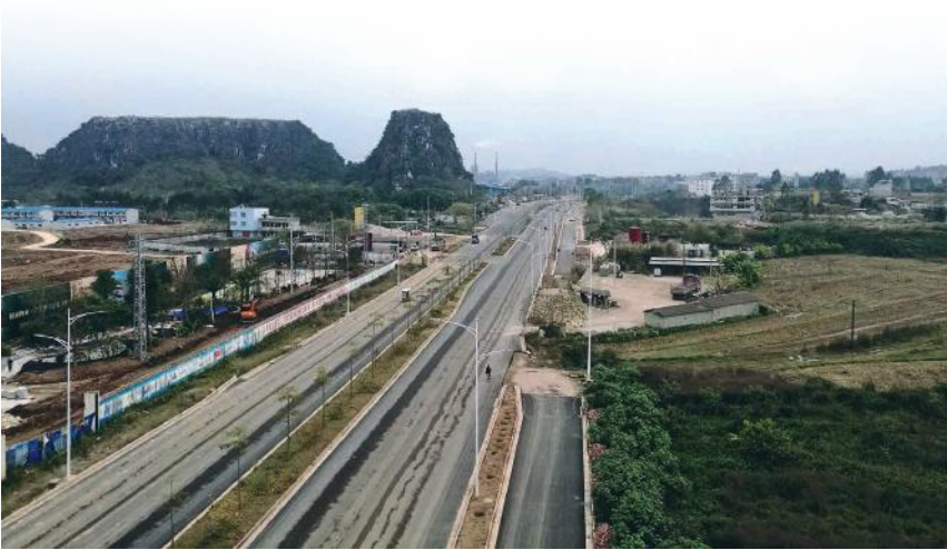
经开区光明路（二期）工程图片