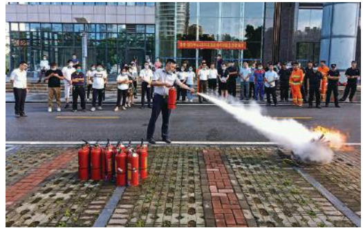
万方物业公司举行消防演练活动

的情况后，物业服务中心启动应急预案，消控室值班人员立马拨打“119”报警，立即关闭燃气阀门和电源，紧急组织疏散各楼层人员到安全区域，5分钟之内，场内人员基本撤离完毕。警戒组在起火楼栋周围拉警戒带进行警戒，灭火组（微型消防站队员）3分钟内赶往现场施救，联络组到园区门口引导消防救援大队车辆。