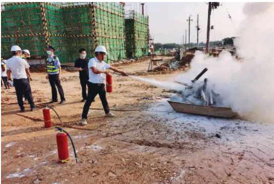
嘉通公司进行消防演练

此次活动主要是模拟火灾发生后的应急处置。活动当天，发现险情后，安全员立即上报，并进行控制和处理，并播报消防疏散通知。在总指挥的安排下，安全防护组、灭火行动组、疏散救援组、通讯联络组同时行动。安全防护组立刻关闭总电源闸门；灭火行动组拿取就近的消防器材进行灭火；疏散救援组迅速引领工人从安全通道撤离到安全地点；通信联络组将现场情况及时反馈给总指挥和现场指挥。待火势完全扑灭，所有人员到达预定安全地点，通讯联络组认真清点人数，确认无任何人员伤亡及财产损失。演练结束后，项目部组织灭火器的实操练习。施工人员按照讲解的动作要领使用了灭火器，对布置的“起火点”进行有效扑救。