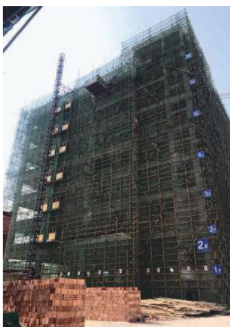
绿港·建科工业园2#楼

据悉，绿港·建科工业园项目位于南宁经开区高岭路北侧，地处经开区繁华中心地带，有着得天独厚的地理位置，交通非常便利。项目占地面积15.622亩，建设3栋厂房，每栋厂房均为七层，总建筑面积24158 m^2 ，项目总投资1.15亿元。项目定位为面向机电产