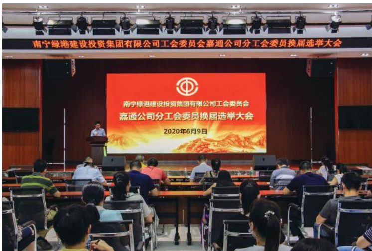
嘉通公司分工会进行换届选举

架构进一步完善，形成集团工会、分工会、工会小组长三级管理。接下来，各级工会组织将进一步树立鲜明的创新导向，切实落实好各项工会工作部署，积极探索新形势下群团工作的