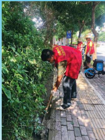
4 挖走淤泥，畅通排水道