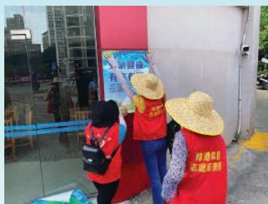
6 走家串户，宣传创城知识