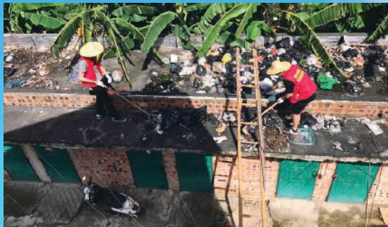
2 上房清垃圾，除去脏和臭