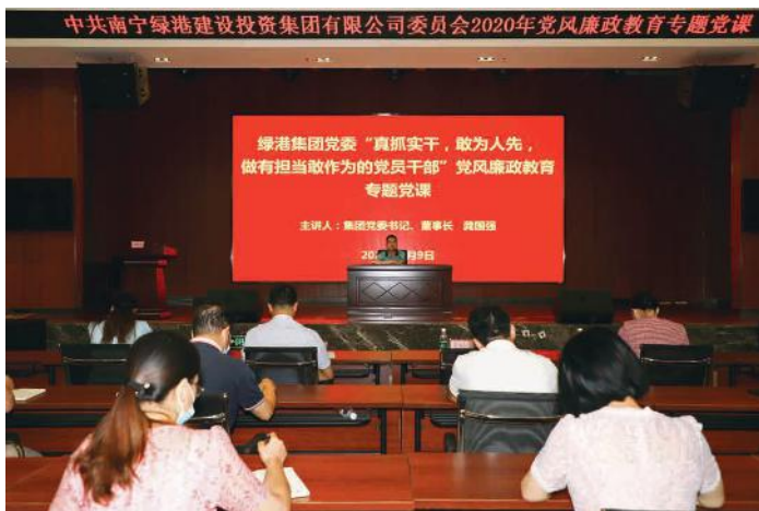
廉政教育党课现场

几点：一是把对党忠诚作为最重要的政治品格。要求党员干部要提高政治站位，对以习近平同志为核心的党中央忠诚，对党组织忠诚，对事业忠诚，对公司忠诚。二是把个人干净作为最起码的从业底线。要求党员干部视党的政策为