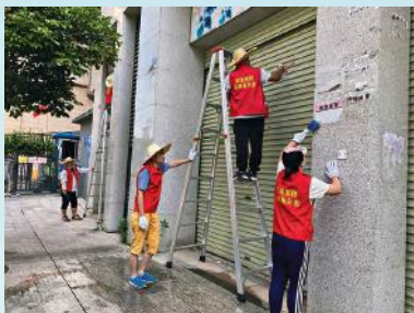
5 清除小广告，还洁净视野