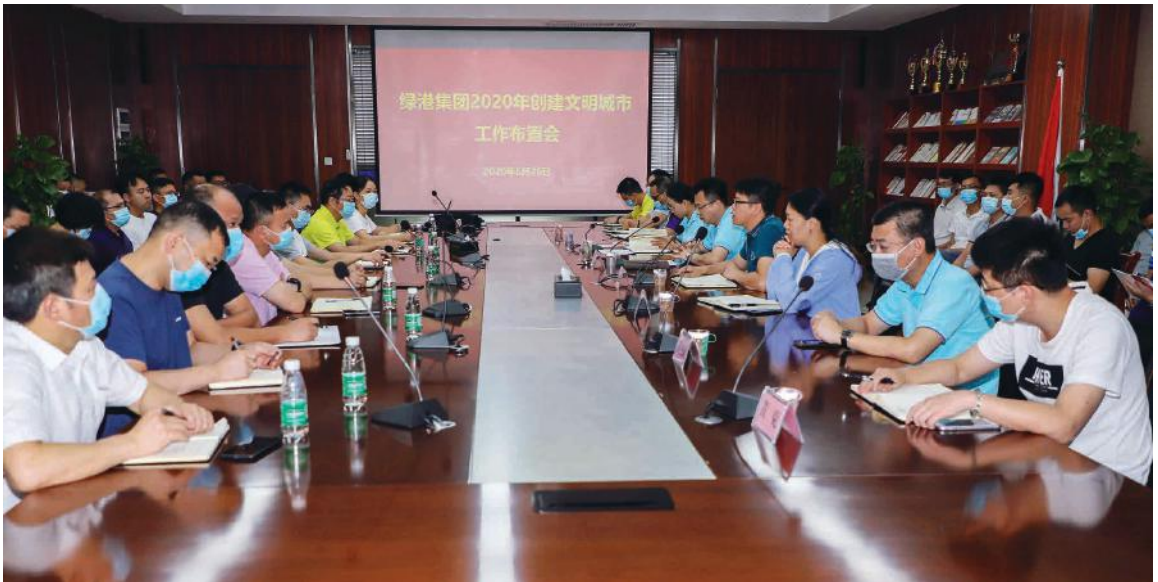
绿港集团组织召开创建文明城市工作部署会

短短二十分钟的会议吹响了绿港集团创城冲锋号角。会后，绿港集团领导班子立即带领全体干部职工奔赴槎路社区网格创城工作一线，