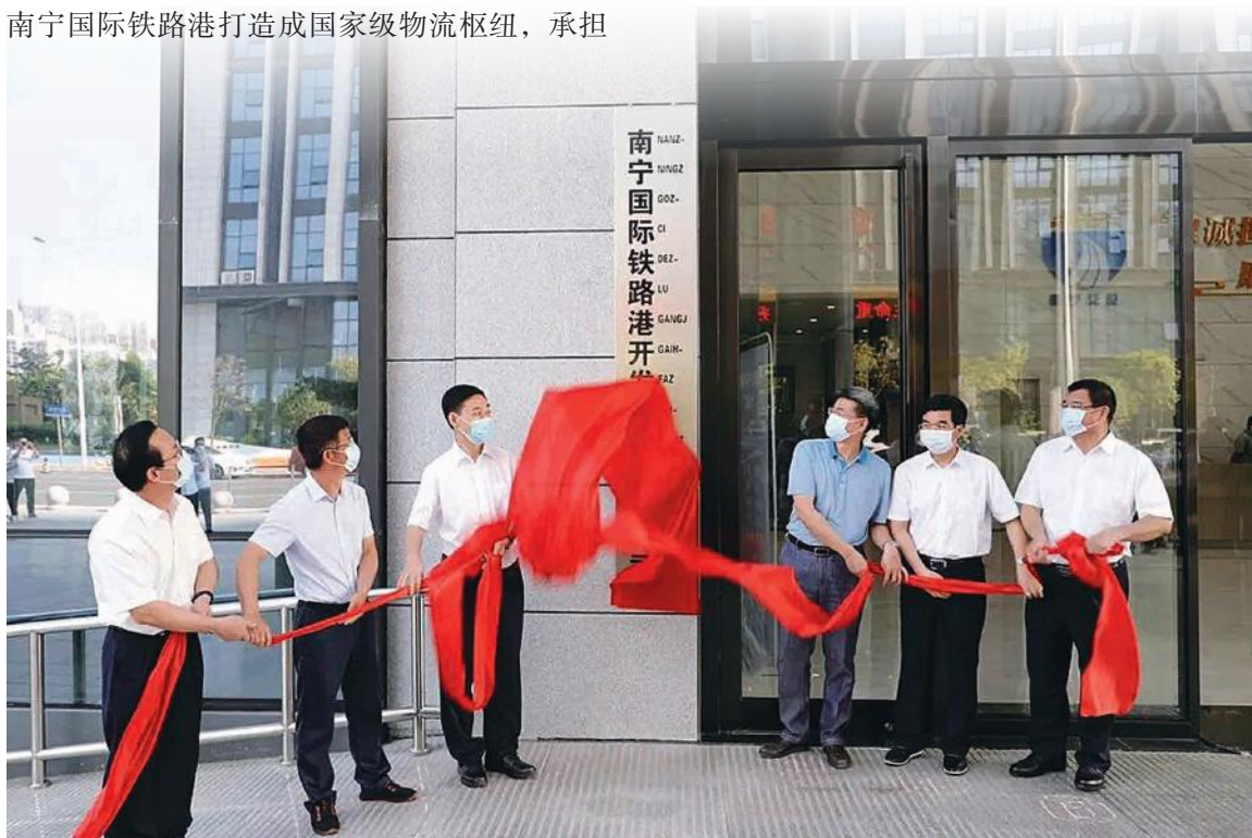
南宁国际铁路港开发运营有限公司正式揭牌成立