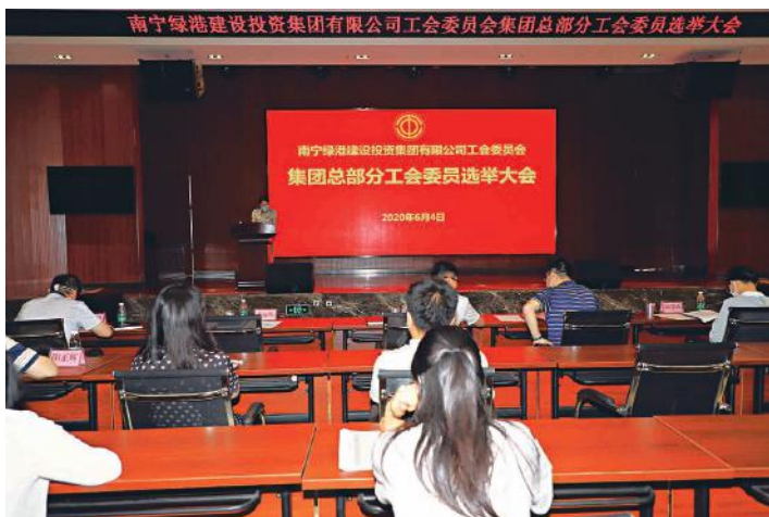
集团总部总开会进行换届选举

及各分工会提出了工作要求。他要求新当选的分工会委员们要不断提高政治站位，为企业发展服务。一要以提升服务企业中心工作大局、服务职工的能力为总目标，共同为企业的健康发展作好保障。二要积极完善组织架构，创新运转体制，增强凝聚力，在集团的发展大局中发挥更大的作用。三要大力弘扬劳模精神，注意培养典型，继续组织开展好创建“工人先锋号”、“先锋示范班组”、“巾帼文明岗”活动，激发广大职工干事创业的激情与活力。四要大力推进优秀企业文化建设，建设“学习型组织”，开展职工喜闻乐见、有益身心的文体活动。五要以收入分配、福利待遇、劳动安全卫生等为重点，推动职工在共建的基础上共享企业发展成果，构建和谐劳动关系，使工会组织真正成为职工群众的“工作之家”、“学习之家”和“生活之家”。