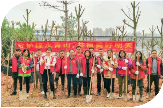
全体植树志愿者合照