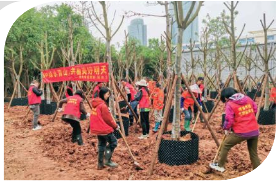
大家热火朝天地参与植树

忙有序，气氛热烈。经过一个上午的时间，一片土地上就种满了 20 多棵人面子树，连片的新树错落有致、迎风挺立，为来年园圃展现百花齐放、绿意盎然的美丽画卷埋下一片勃勃生机。