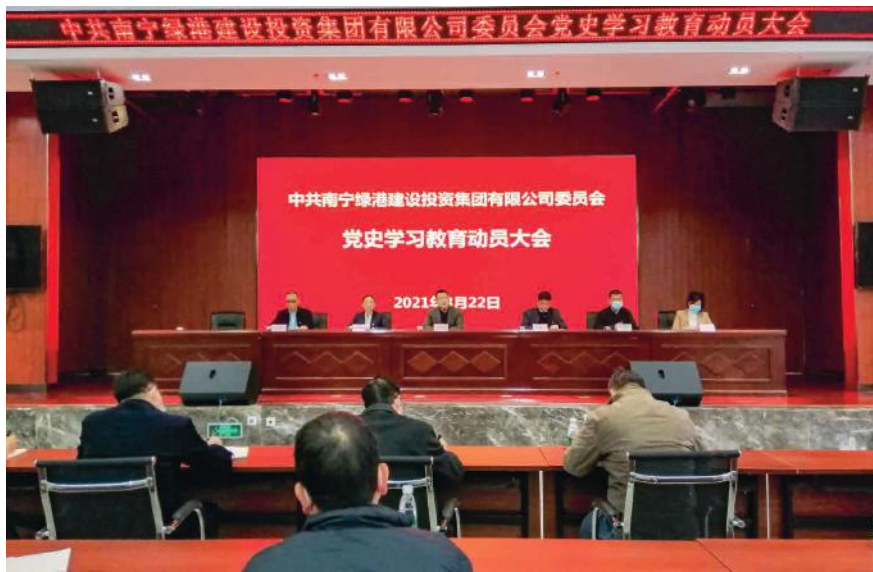
党史学习教育动员大会现场

他强调，集团公司各党支部、各部门、各子公司要认真学习领会党中央和自治区、经开区党委的决策部署，要大力弘扬理论联系实际的马克思主义优良学风，努力把学到的知识、掌握的规律切实转化为解决发展、应对风险挑战的能力，在努力打造经开区国企标