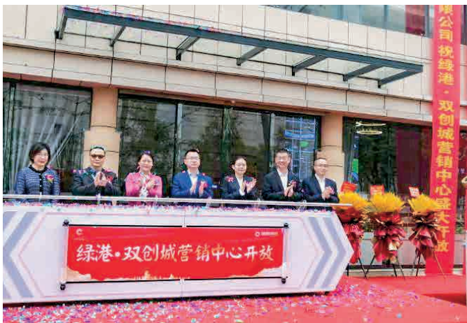
绿港·双创城营销中心开放

下一步，绿港集团将继续拓宽销售招商渠道，总结销售招商经验，改进销售招商方式，提倡全员营销，争取引进更优质的项目。同时，坚定不移地推进市场取向的改革，大胆破除旧的思维模式，进行市场化运作，多管齐下，助力南宁临空经济示范区成为南宁经济新增长极。