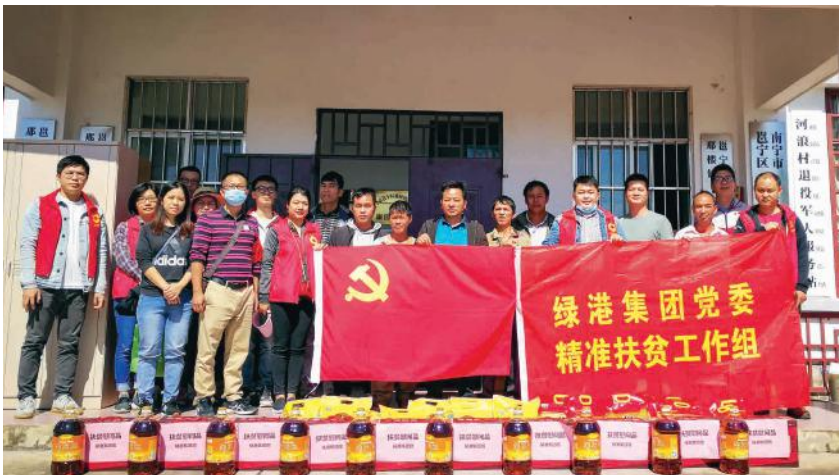
绿港集团开展2020年度“全国扶贫日”、帮扶行动月入户慰问活动

为更好地服务园区企业，绿港集团成立了下属的物业公司——南宁万方物业服务有限公司，大力为入园企业提供优质物业服务。每个园区成立一个物业管理处，形成了以集团公司为主导、万方物业为主体的，入园企业积极参与的“三位一体”新型管