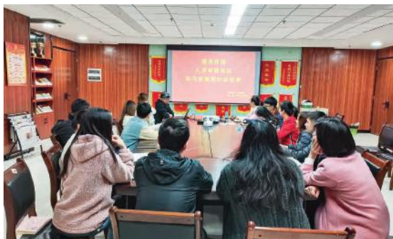
绿港集团见习管理制度专题学习会现场

此次专题学习会分为三个学习板块，一是对《广西壮族自治区就业见习管理办法》以及绿港集团见习管理制度的深入学习，会议上通过对政策与制度的宣贯和解读，帮助大家切实把握见习人员相关的规定，工作中严格在制度范围内依规行事；二是参会人员通过观摩广西就业见习管理系统操作规程的操作演示，了解就业见习人员的申报流程、申报材料等内容，负责演示操作的同事不时有针对性地向大家提醒申报工作的关键节点与易错点，并且还提出相应的解决办法和思路方向，帮助大家有效规避申报工作的失误；三是在会议上由主持人发起讨论，引导大家对见习管理工作进行互动探