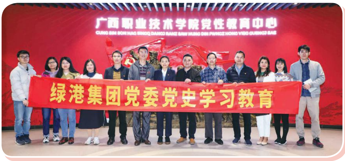
党员们在党性教育中心合影

走进红色基地、听故事、学党史、召开专题学习会……2021 年是中国共产党成立 100 周年，为了让红色基因、革命薪火代代传承，近期，绿港集团陆续开展了形式多样、丰富多彩的活动，推动党史学习教育走深走实。