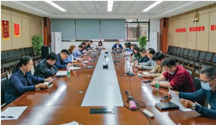
创新和亮点评审小组召开“2021年攻坚项目（事项）工作初评会议”

3月26日，集团公司决定将“同兴路（海城路-铁山港西路）工程攻坚、教育类重点项目攻坚”等8个重大项目、“建党100周年系列活动及党建示范点升级打造攻坚、拓展融资渠道，创新融资工具攻坚”等8个重点事项、“重大执行案件攻坚、调整业务核算管理模式，优化关键财务指标攻坚项目”等4个难点问题列为2021年攻坚项目（事项）共20项，实施克难攻坚，重点推进。每一个重点攻坚事项都明确了年度目标、任务