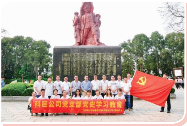
科巨公司党支部全体党员在纪念碑前合影

3月22日绿港集团党委组织党员干部来到“中国红军第七军第八军纪念广场”，一边回顾党史，一边开展2020年组织生活会，创新的引入“组织生活+党史”的形式，让组织生活会走出会议室、走到室外、走进党史。在纪念广