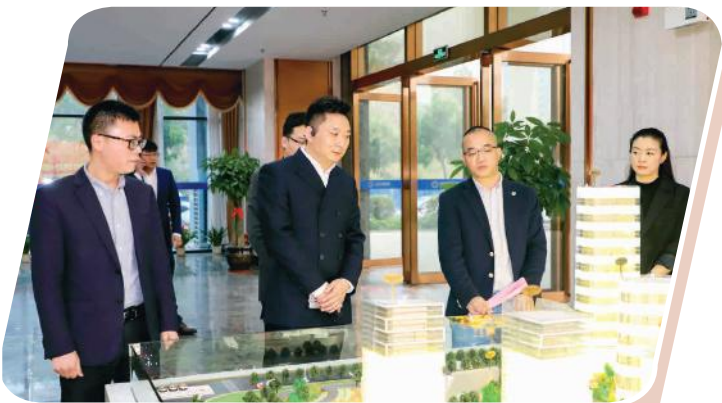
交流组了解集团公司项目情况

最后，与会人员就如何加强各业务板块的运营、加强各领域合作以及各自关心的问题进行深入探讨和洽谈。下一步，双方将继续加强对接交流，积极寻找合作契机，助推南宁临空经济示范区及南宁市整体经济发展和城市建设，提升城市影响力。