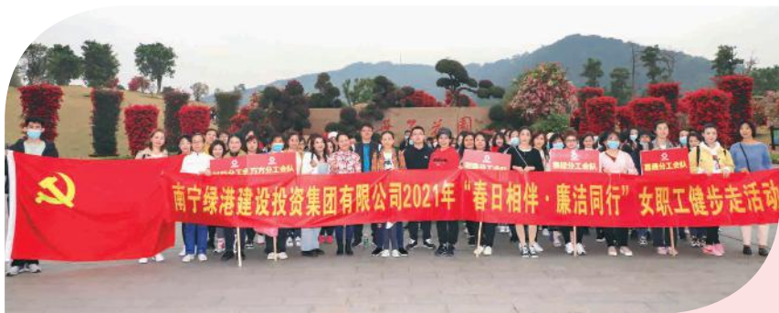
全体女职工与集团领导合影