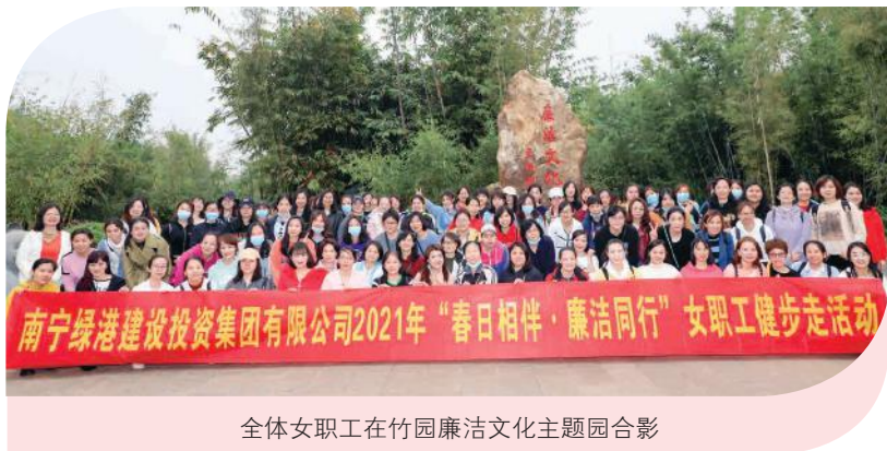
全体女职工在竹园廉洁文化主题园合影

此次活动既活跃了身心，又增进了同事之间的交流，更坚定了新一年砥砺奋进的信心。相信在新的一年里，绿港集团女职工们将不负春光，不辱使命，凝心聚力，积极乐观，健康向上，以更加饱满的精神和健康体魄投入到工作中去，在平凡的岗位上创造新的辉煌，用她们的笑容和行动为绿港集团“十四五”开好局、起好步增添一道道更加靓丽的风景线！