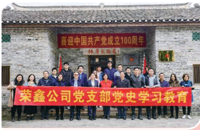
荣鑫公司党支部全体党员在林景云烈士故居合影