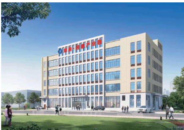
绿港·迎鹏产业园效果图

造业为主的现代化产业园，主要服务于塑料制品生产、包装及其上下游产业的加工和生产，并提供物业管理等配套服务设施。项目建成后，将进一步完善经开区的产业配套，拓展经开区的发展空间，有利于加速企业入园步伐，全面落实强首府战略，推动经开区工业高质量发展。